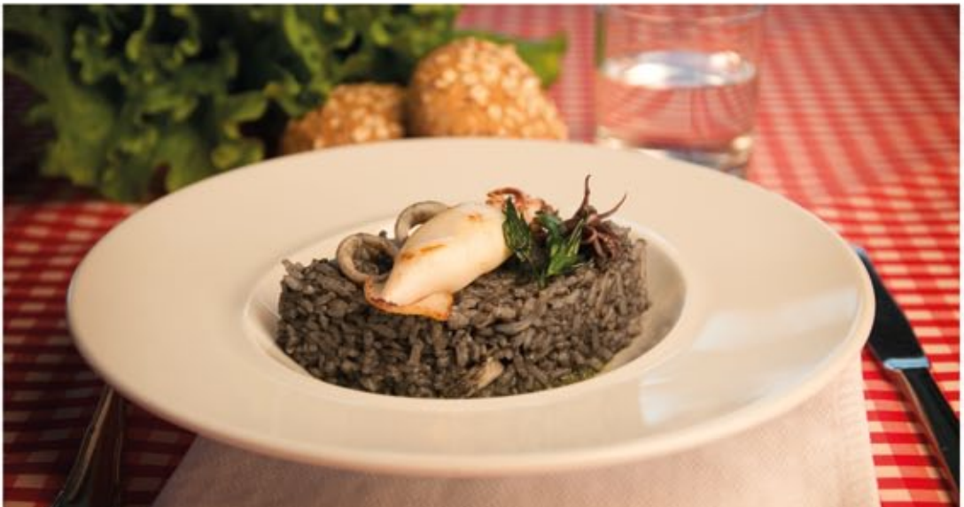
* Arroz negro con sepia y calamares

Filete de cerdo magro y coles de Bruselas al vapor. Ingredientes: 75 g de filete de cerdo, 50 g de coles de Bruselas y aceite.