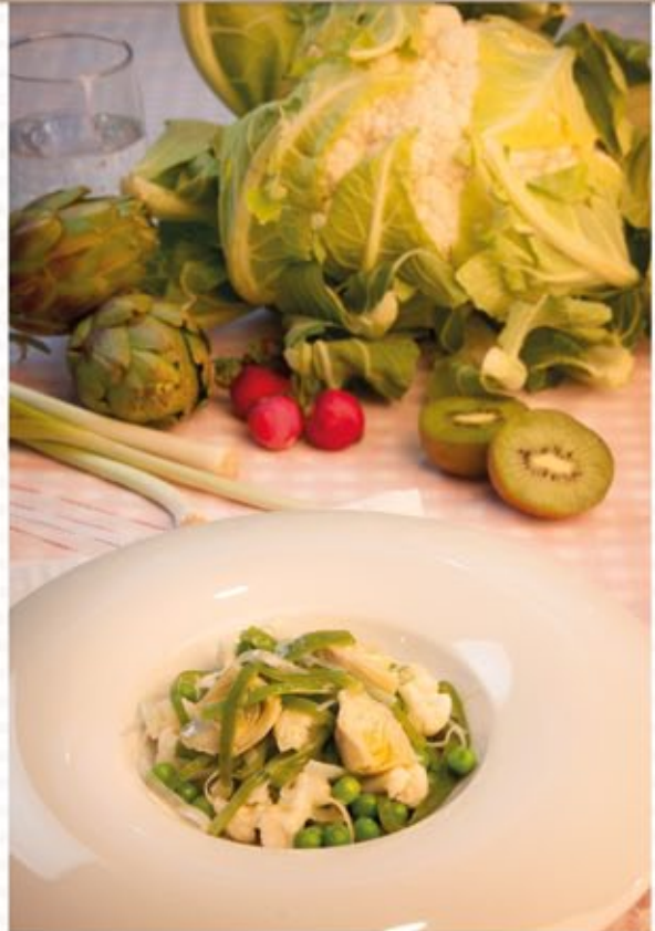
* Menestra de verduras