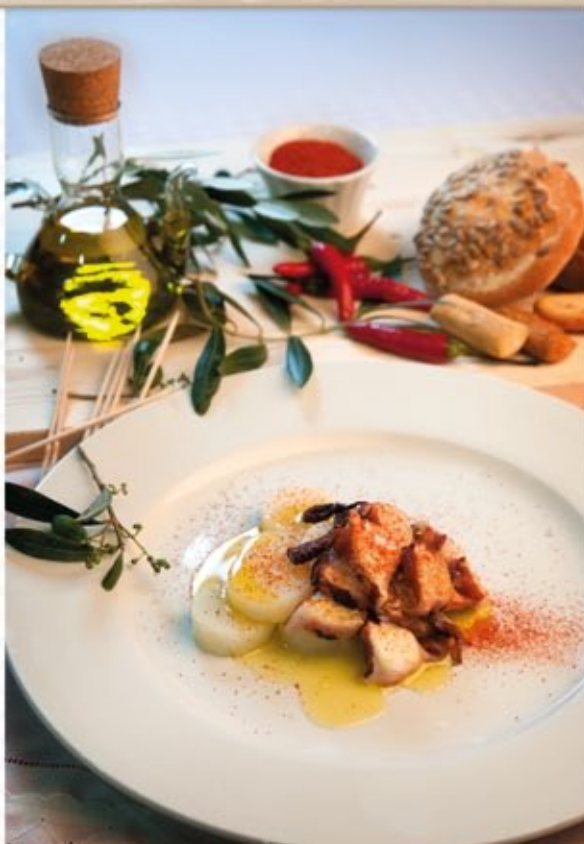
* Pulpo á feira con patatas

Filete de ternera a la plancha con guarnición de arroz y hortalizas al vapor 2 ciruelas verdes Pan