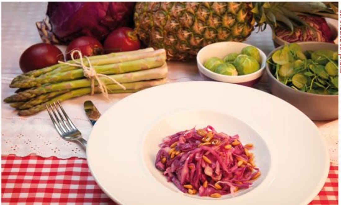
* Col lombarda con piñones

Ingredientes: 60 g de pan, 50 g de queso e 50 g de membrillo.