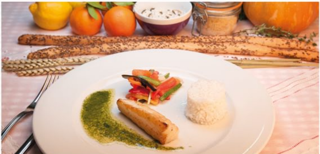
* Pisto de verduras al horno con bacalao

Ingredientes: 80 g de patata, 60 g de acelgas, 50 g de brécol, 40 g de puerro, 40 g de judías verdes, 30 g de zanahoria y aceite.