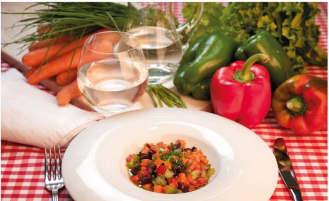
* Ensalada de zanahoria

Ingredientes: 100 g de calabaza, 100 g de patata, 90 g de leche, 75 g de zanahoria y aceite.